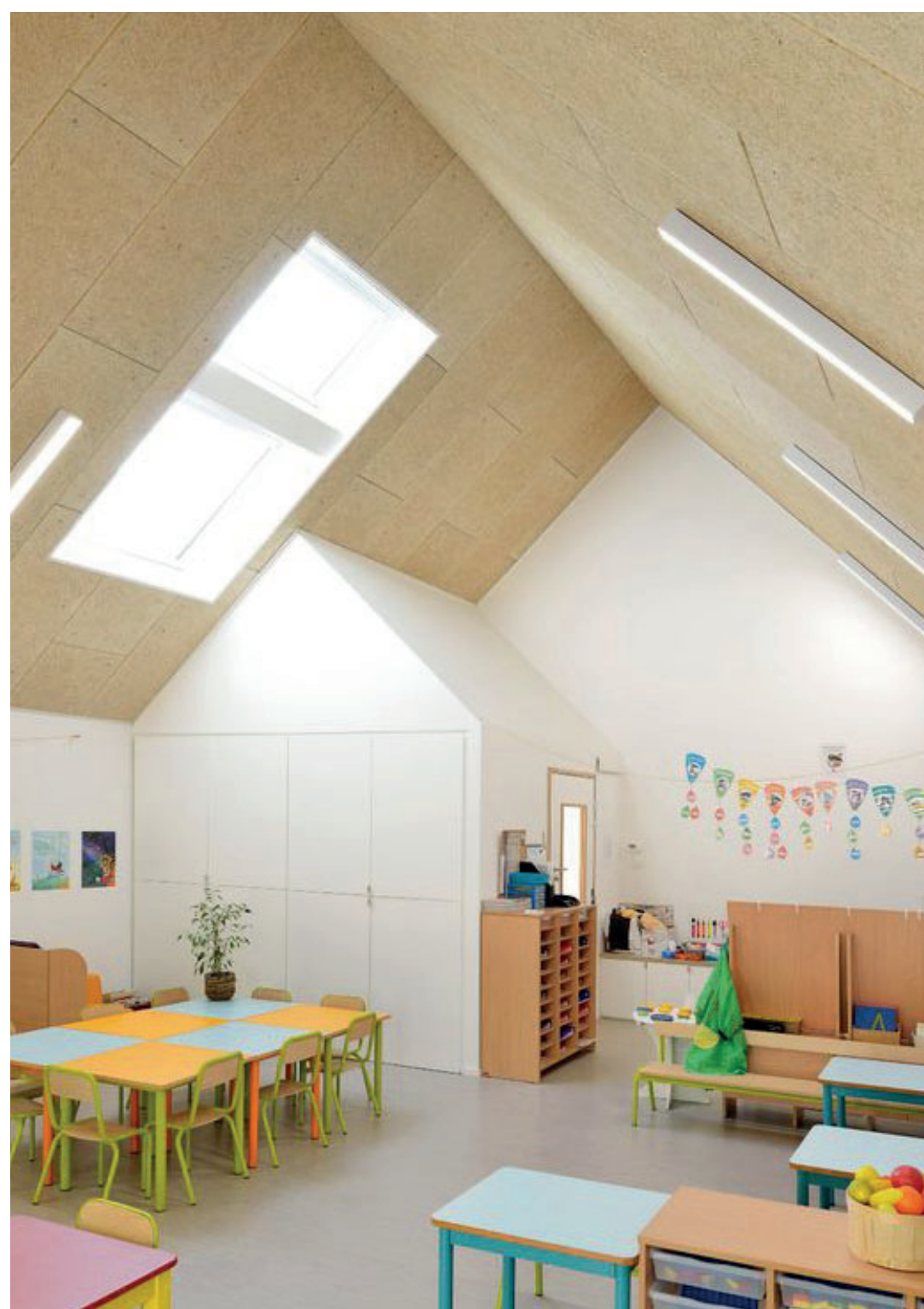
Omslutande rumslighet med mindre rum i rummet nära barnens skala