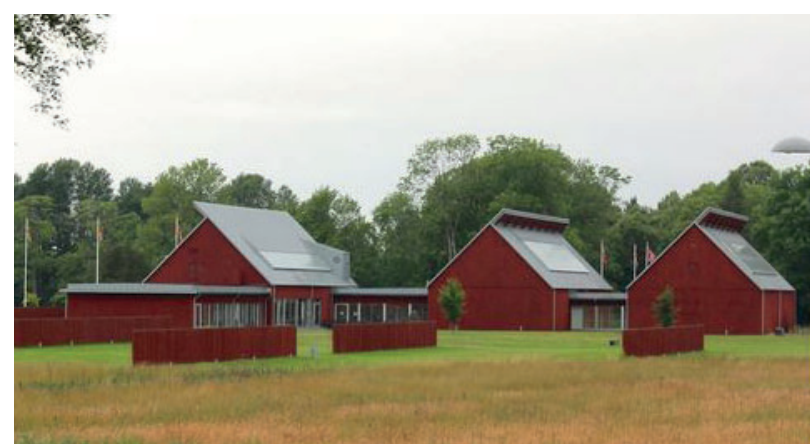
Flera mindre gavelmotiv skapar småskalighet i en stor struktur