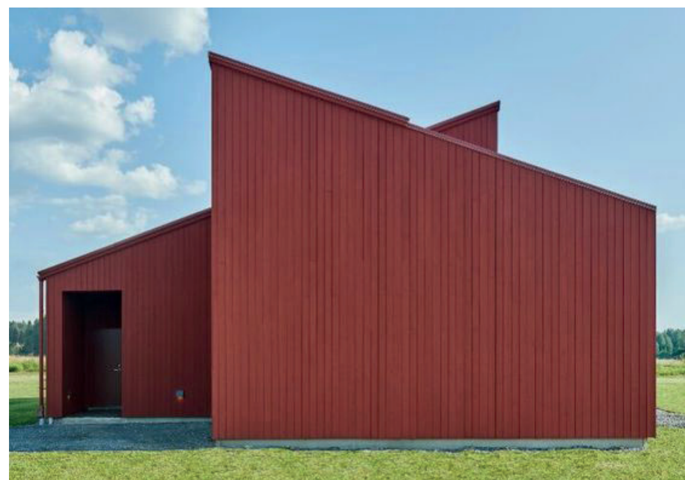
Gavelmotiv i mindre skala. Rödmålad fasad som knyter an till platsens arkitektur.