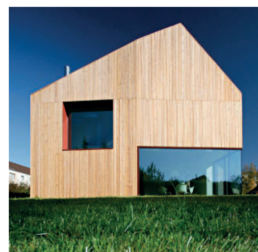
Exempel på hur en volym kan brytas ner i skala och upplevas mer småskalig