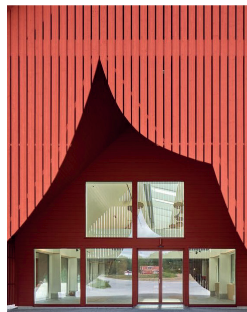
Möjlighet till modern snickarglädje som skapar identitet