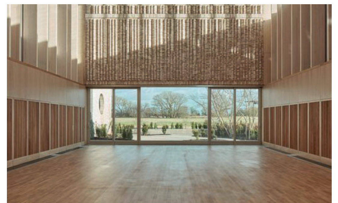
Möjlighet att öppna upp partier och nyttja salar även utifrån