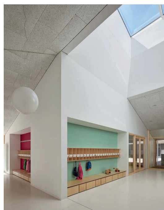
Ljusinsläpp i tak