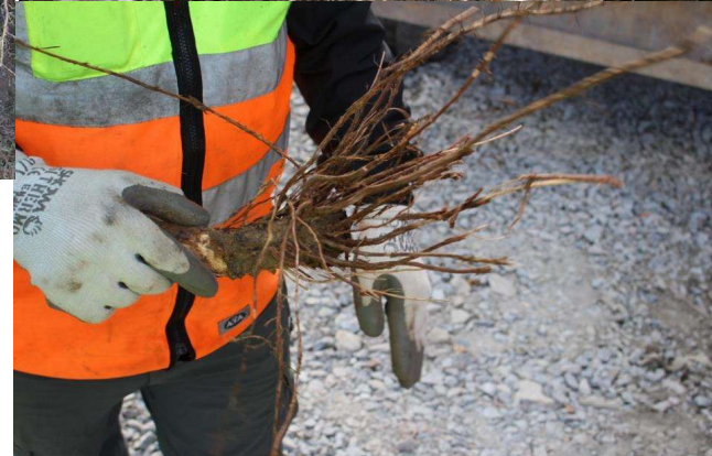
Massiv rotutveckling 2 år efter beskärning