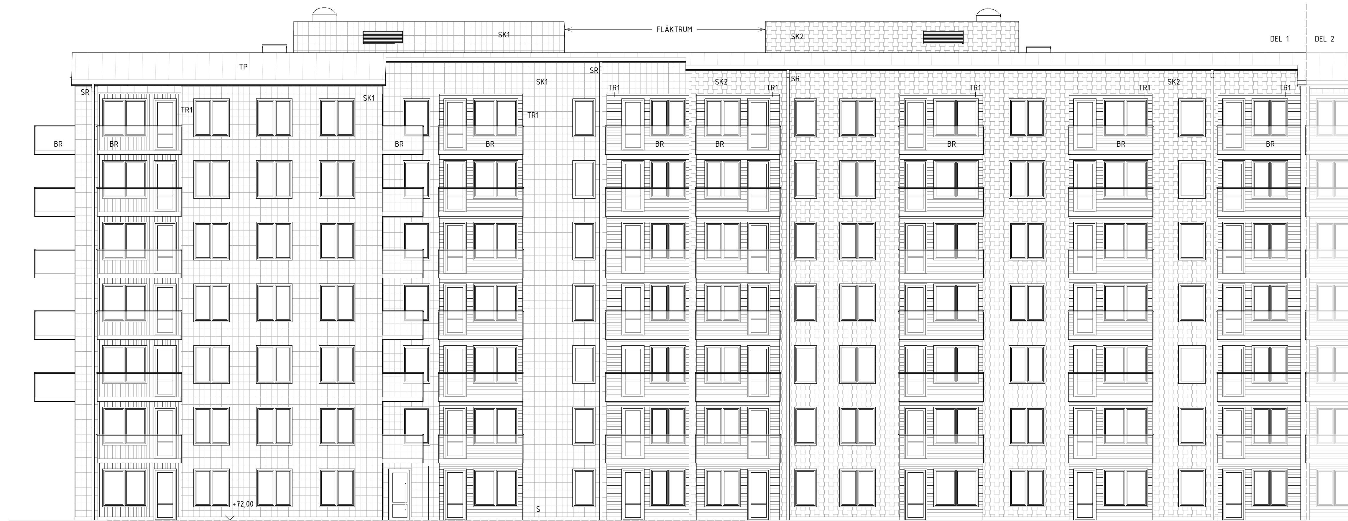
Fasad mot Söder, TR1-TR2

FÖRKLARINGAR, MATERIAL & KULÖR SE A-40.0-2001