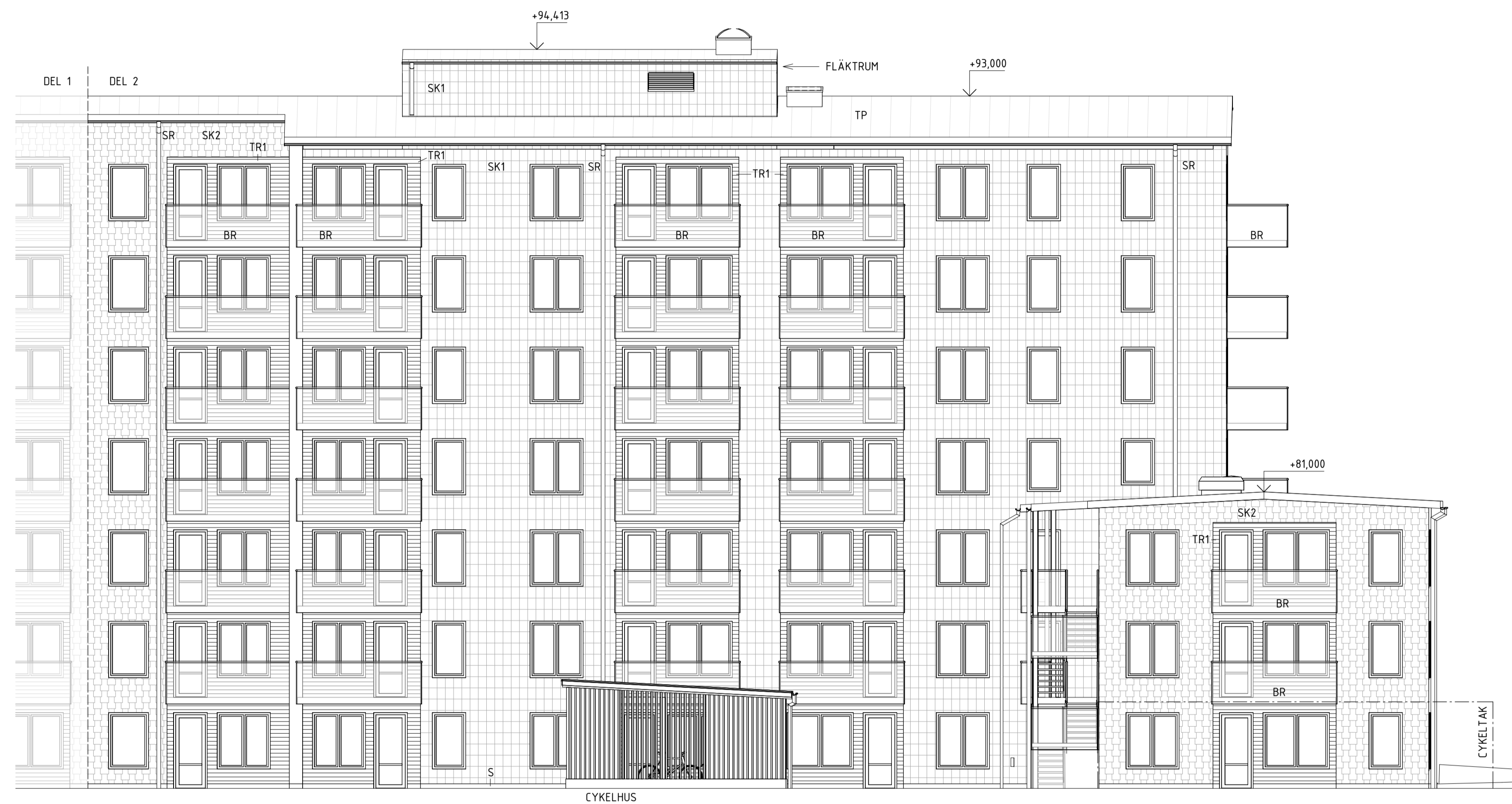
Fasad mot Söder, TR3

FÖRKLARINGAR, MATERIAL & KULÖR SE A-40.0-2001