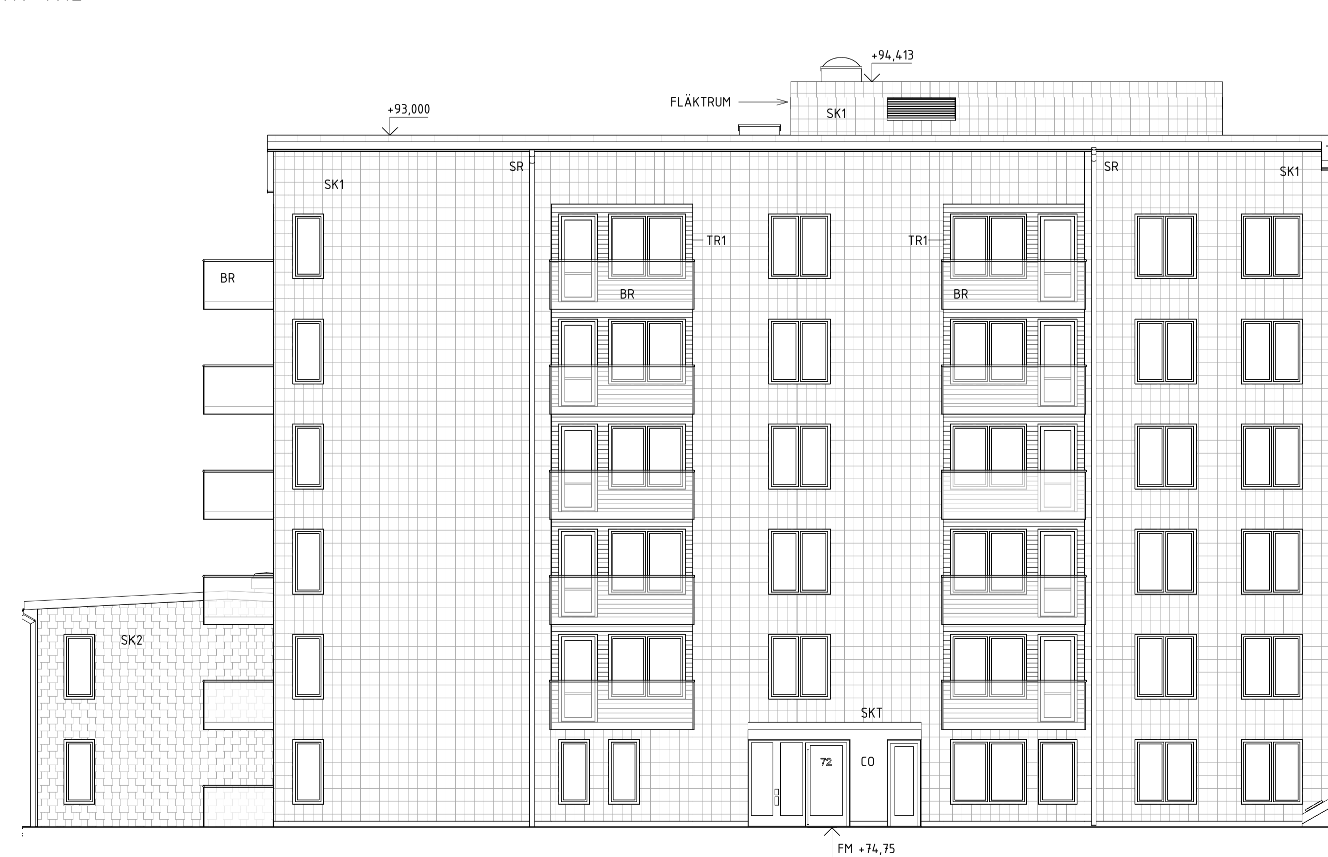
Fasad mot nordost, TR3