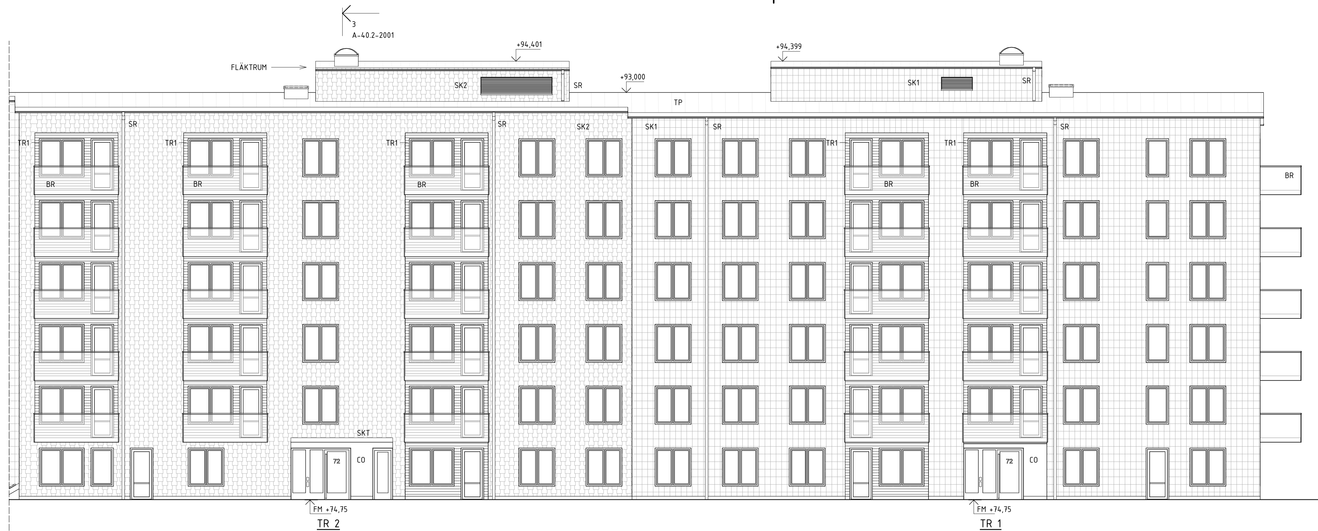
Fasad mot nordost, TR1-TR2

FÖRKLARINGAR, MATERIAL & KULÖR SE A-4.0-2001