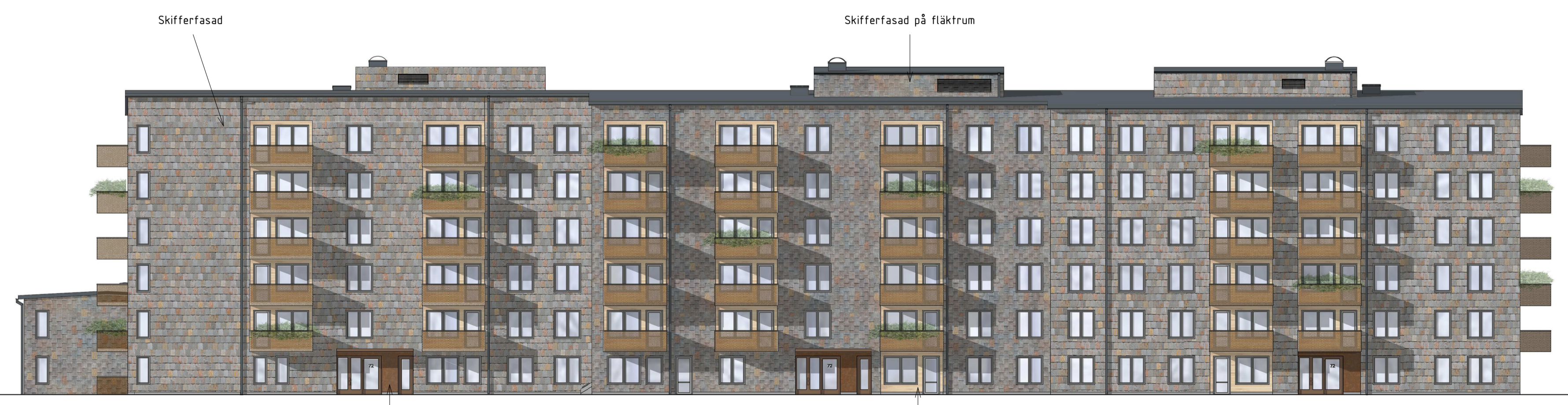
Fasad mot nordost