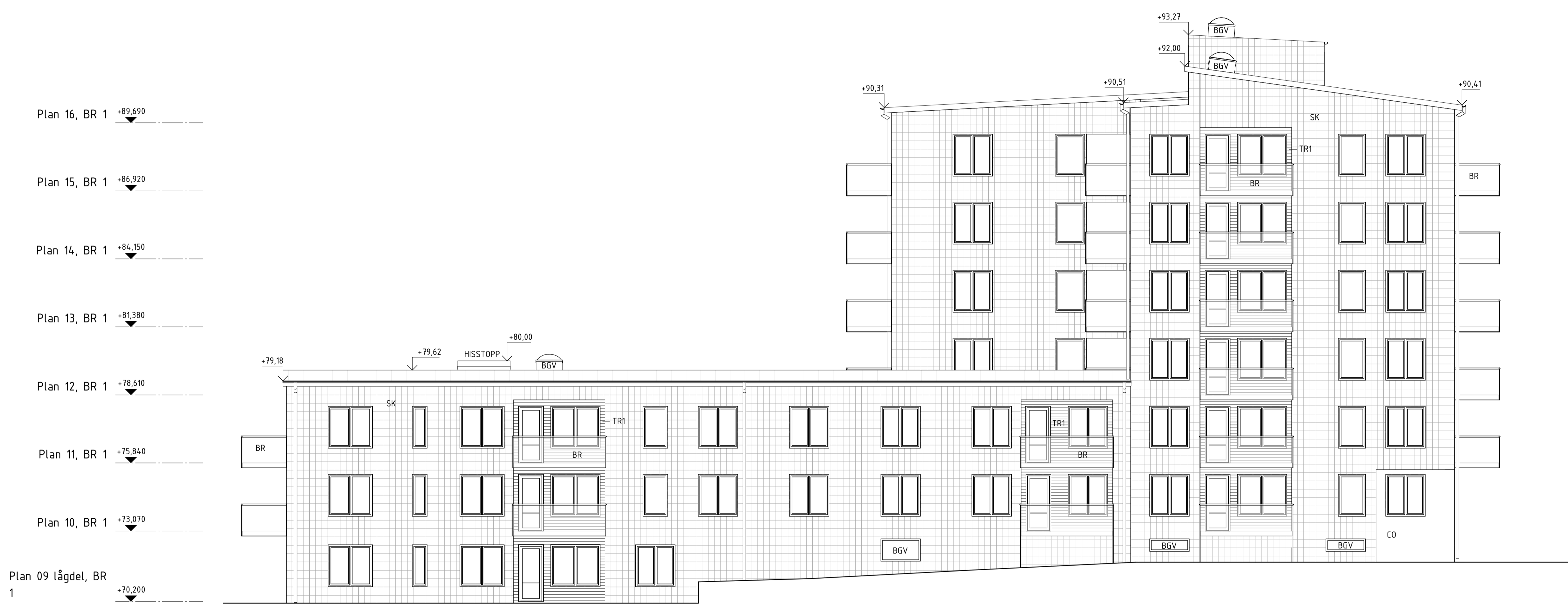
FASAD MOT SYDOST

FÖRKLARINGAR, KULÖRER OCH MATERIAL, SE A-40.0-1001