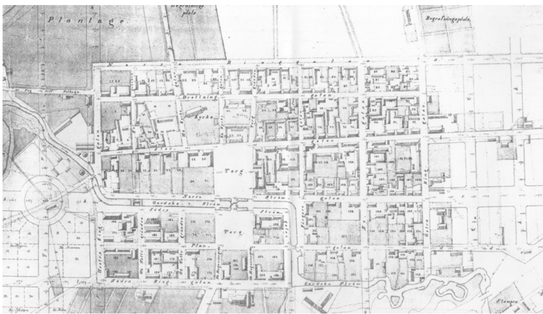
Del av Th Wästfels stadsplaneförslag 1876