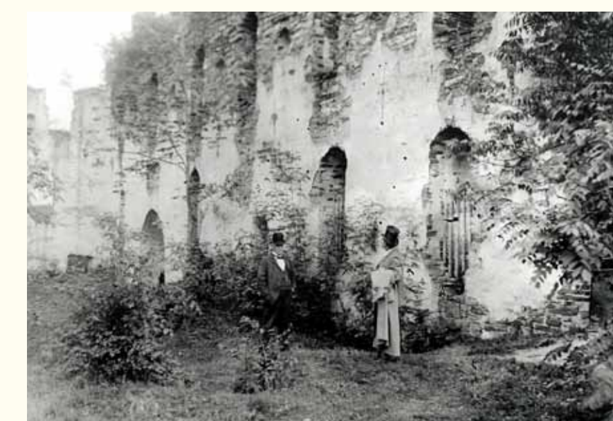
På 1890-talet var slottet en ruin.

Samma år anlades en stor engelsk park omkring slottet, varav det än idag finns kvar storvuxna lövträd.