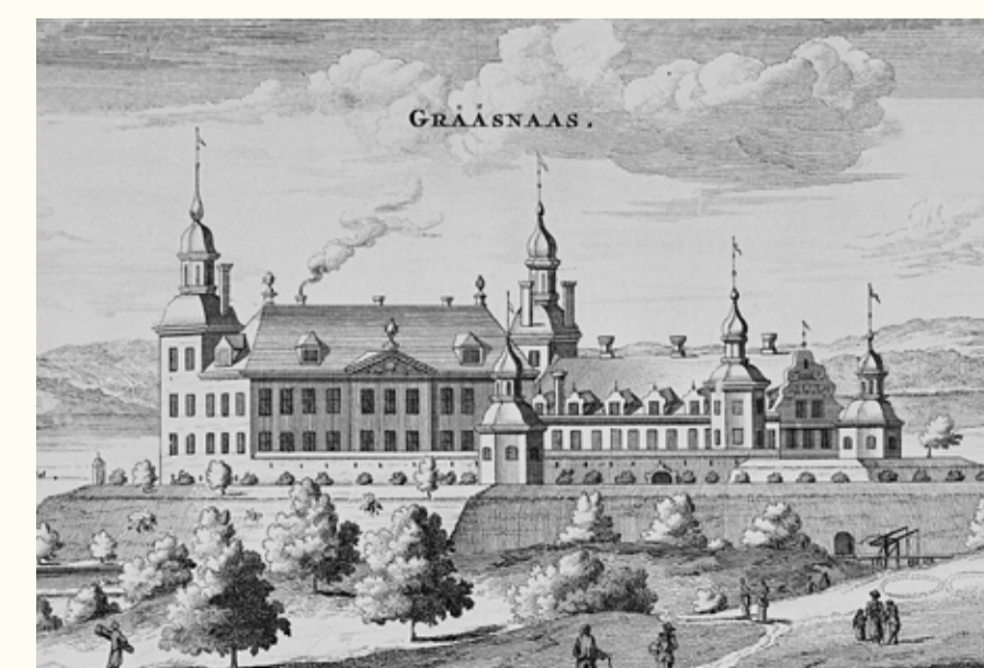
Gräfsnäs slott enligt Erik Dahlberg. Tecknat på 1600-talets senare hälft, ur Svevica Antiqua .

Den ruin vi idag ser är till stora delar från denna tid.