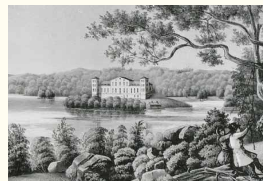
Slottet som det såg ut före branden 1834. Tecknat av Thora Thersner.