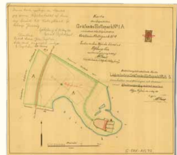
Västergötland-Göteborgs Järnvägs AB köpte slottsparken med ruin 1911. Kartan är från samma år.

Enligt traditionen skall ett medeltida hus funnits på samma plats där slottet senare uppfördes. Arkeologer kunde vid utgrävningarna på 1930-talet konstatera att slottets södra del rymde rester av en medeltida byggnad. Även markradarundersökningar 2009 har påvisat spår efter förmodade medeltida lämningar.